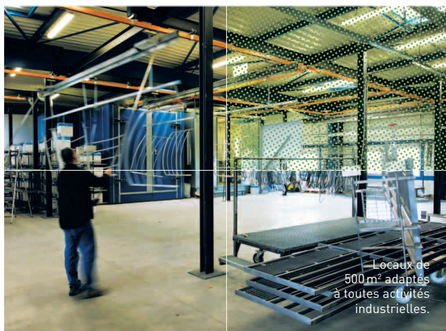
Locaux de 500 m 2 adaptés à toutes activités industrielles.

UN PROGRAMME IMMOBILIER POUR LES ENTREPRISES ARTISANALES ET INDUSTRIELLES LANCÉ EN 2007 SUR LE PARC D'ACTIVITÉS DES LIVRAINDIÈRES, AU NORD DE DREUX AGGLOMÉRATION