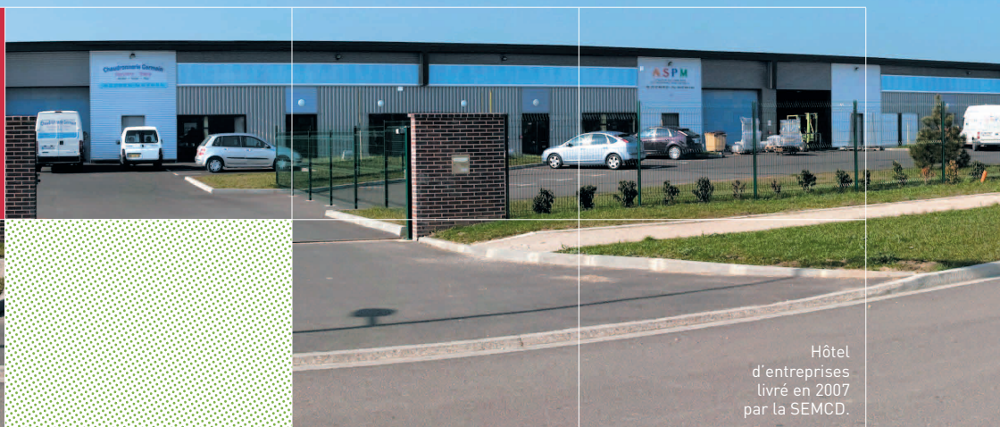
Hôtel d'entreprises livré en 2007 par la SEMCD.

PRODUIT DE LA GAMME PARCOURS RÉSIDENTIEL